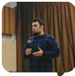
Președinte Șerban Pitic